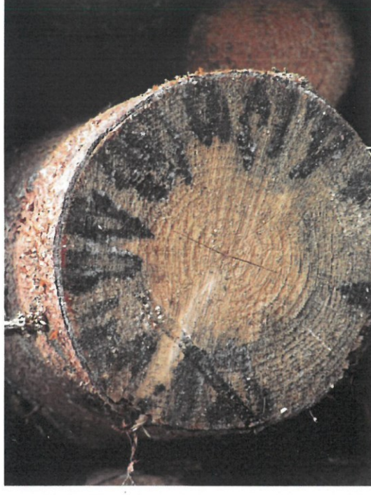
Zamodrání větší než 1/4 tloušťky čela čepu