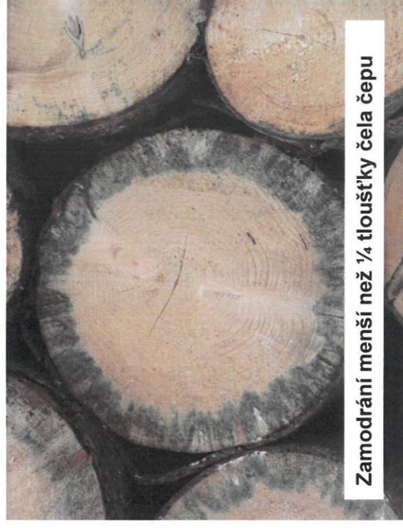
Zamodráání menší než ¼ tloušťky čela čepu